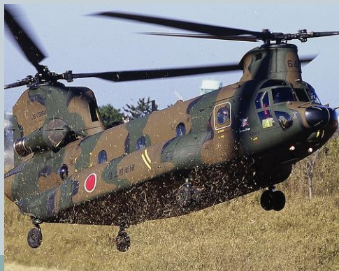
CH47A JGSDF webpage