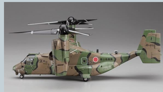
陸自オスプレイのプラモデル ハセガワ