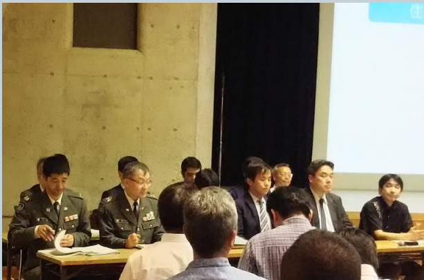
4月22日説明会に出席した沖縄防衛局と陸上幕僚部のメンバー