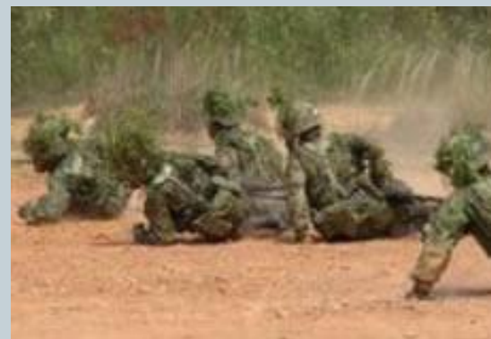
野外訓練 JGSDF webpage